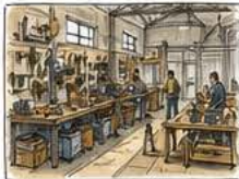
ATELIERS & RESSOURCERIE réception, tri, stockage, ateliers de réparation et fabrication