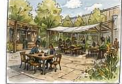
ESPACES EXTÉRIEURS terrasse, jeux, détente, convivialité