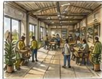
ESPACES PARTAGÉS coworking, rencontres, formation, événements