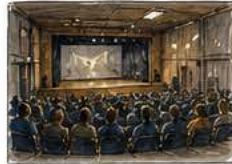
SALLE DE SPECTACLE diffusion, résidences, actions culturelles