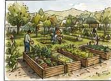
JARDINS & NATURE potager, biodiversité, îlot de fraîcheur